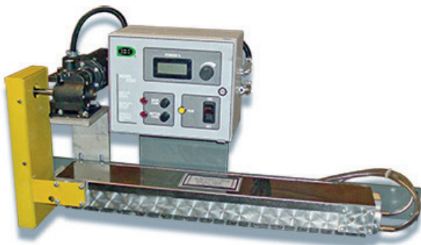
Equipo Pulverizador Electrostático

Las cadenas de suministro estables han sido nuestro sello distintivo, lo que permite tiempos de entrega cortos y mezclas personalizadas. Múltiples tamaños de paquetes están disponibles proporcionando la mayor flexibilidad para el uso en la prensa. La prueba por lotes garantiza una cobertura de rodillos consistente, tasas de entrega específicas y composición. Nuestro uso constante de ingredientes puros y naturales garantiza una imprenta saludable.